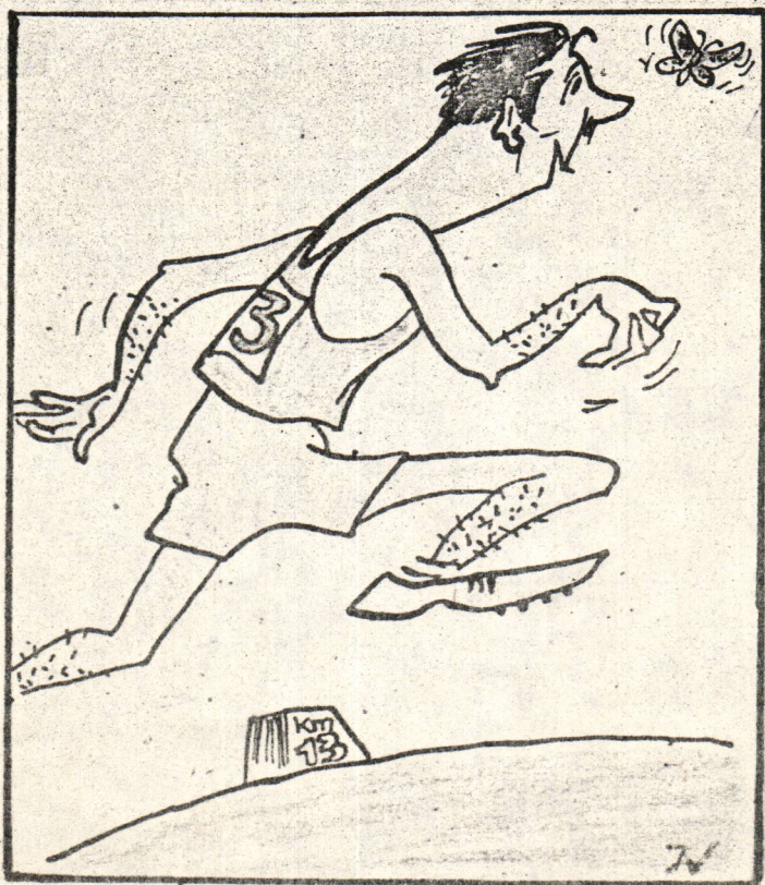
Fiecre cu fluturasul său